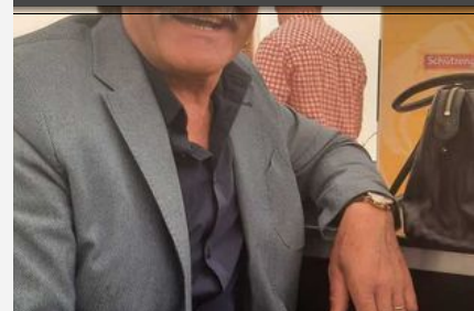
17. Alpenland Musikfestival